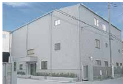
サイモト自転車株式会社